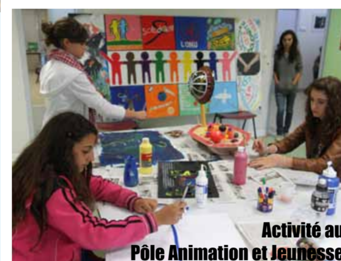
Activité au Pôle Animation et Jeunesse