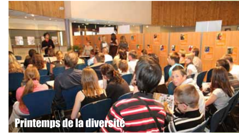
Printemps de la diversité

Pour renforcer les liens de solidarité, de nouvelles structures et actions ont été créées, en priorité vers les publics les plus isolés. La solidarité est l'affaire de tous, un engagement citoyen au quotidien.