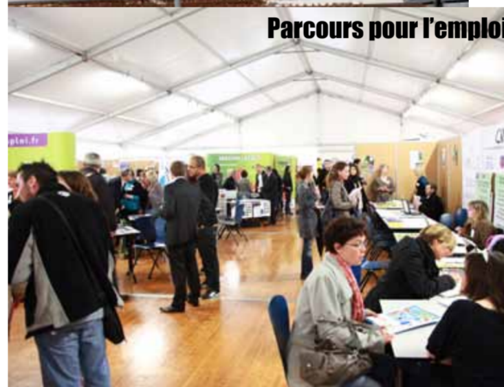
Parcours pour l'emploi