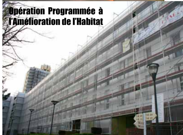
Opération Programmée à l'Amélioration de l'Habitat