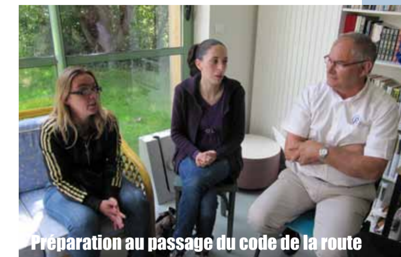
Préparation au passage du code de la route