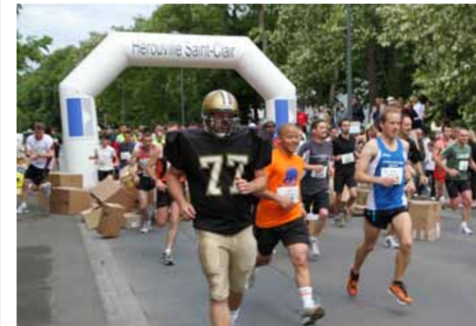
Hérouville dans la course