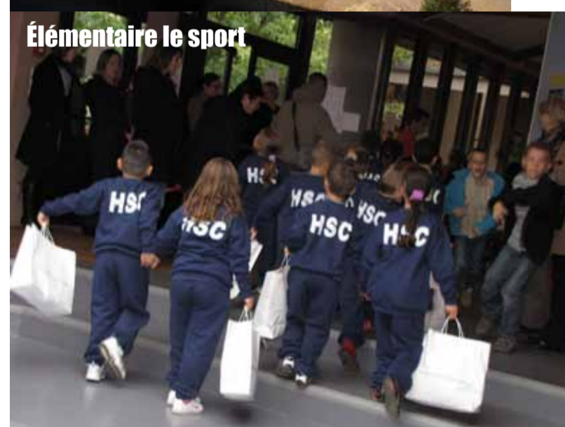
Élémentaire le sport