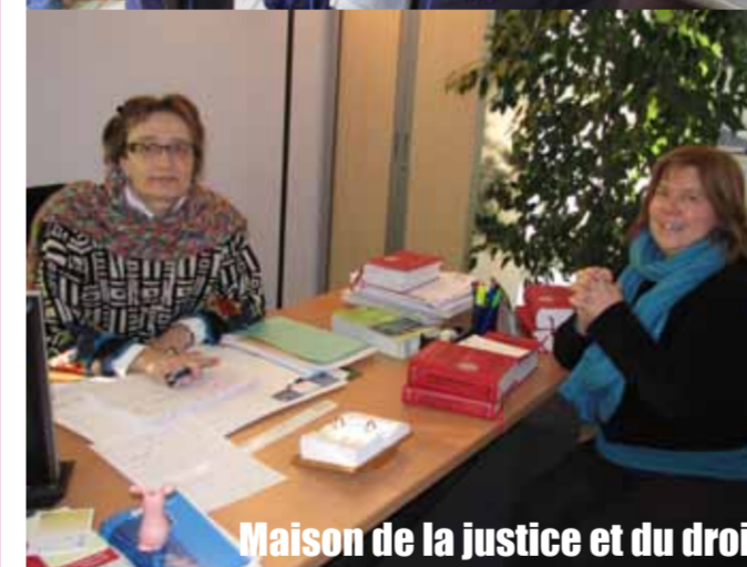
Maison de la justice et du droit