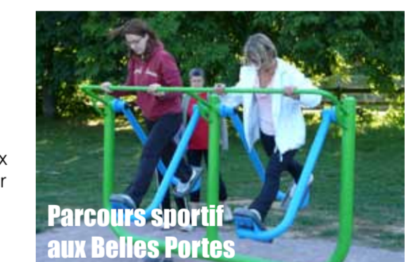
Parcours sportif aux Belles Portes

- travaux d'accessibilité Personnes à Mobilité Réduite, notamment à l'Espace Loisirs Sportifs Hérouville (20 000 € travaux) dans le cadre des 385 000 € de réhabilitation des bâtiments - un parcours de course d'orientation dans le bois de Lébisey et un parcours sportif aux Belles Portes (terrain des cratères)