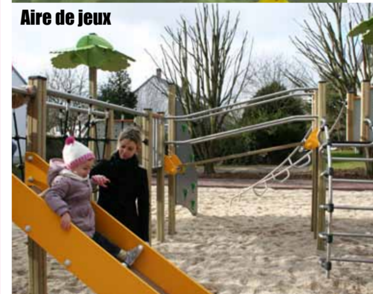
Aire de jeux