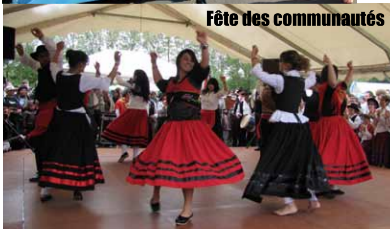
Fête des communautés