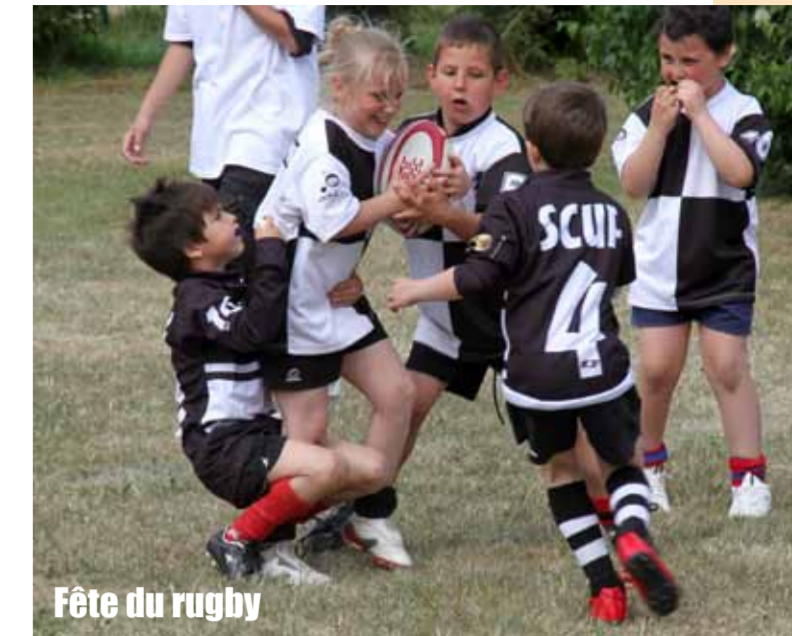
Fête du rugby

Hérouville s'investit en faveur du sport avec une quarantaine d'associations sportives.