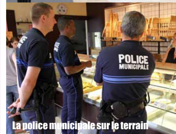
La police municipale sur le terrain