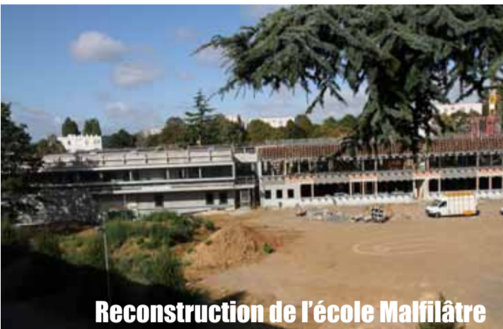
Reconstruction de l'école Malfilâtre