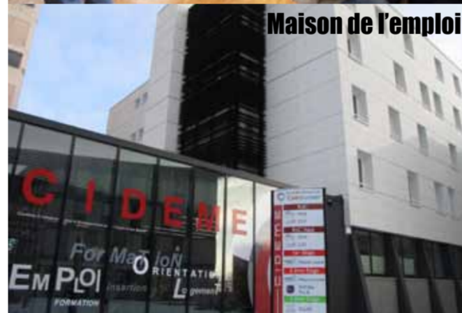
Maison de l'emploi