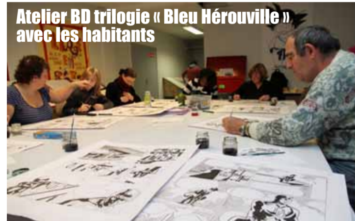
Atelier BD trilogie « Bleu Hérouville » avec les habitants

Dotée d'équipements culturels de grande qualité et d'un tissu associatif très dense, Hérouville se distingue par la pluralité des actions culturelles menées en priorité auprès des habitants, mais aussi à l'international.