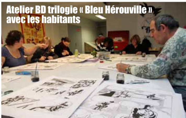
Atelier BD trilogie « Bleu Hérouville » avec les habitants