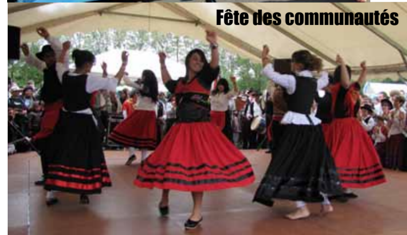
Fête des communautés