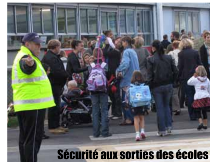
Sécurité aux sorties des écoles

Contact : Secrétariat du cabinet - 02 31 45 33 14