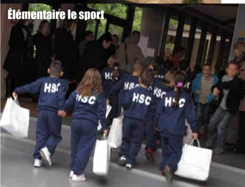
Élémentaire le sport