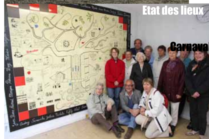
Etat des lieux