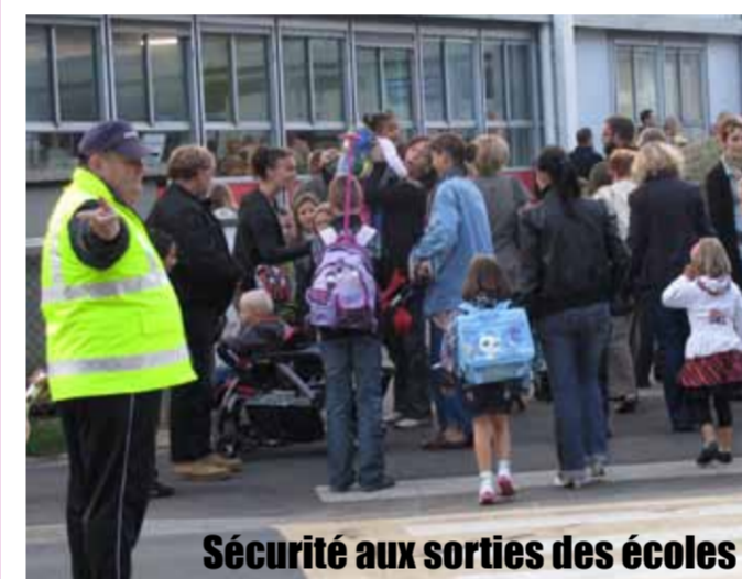
Sécurité aux sorties des écoles