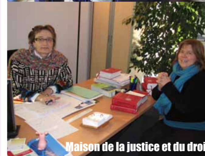
Maison de la justice et du droit