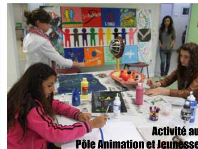
Activité au Pôle Animation et Jeunesse

Deux projets phares au printemps 2011 : la « Semaine du Handicap » pendant les vacances de Pâques (une semaine d'activités jeunesse adaptées à tout public) et le Marché de printemps, sur le site de la Fonderie, le 17 avril. Au programme de cette journée qui fut un succès : un marché bio, une exposition sur l'écocitoyenneté, des animations en direction de la jeunesse.