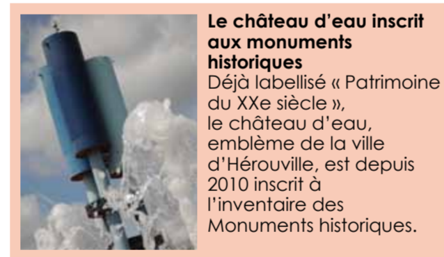
Le château d'eau inscrit aux monuments historiques Déjà labellisé « Patrimoine du XXe siècle », le château d'eau, emblème de la ville d'Hérouville, est depuis 2010 inscrit à l'inventaire des Monuments historiques.

Afin d'accompagner toutes les initiatives des associations socio-culturelles, la Ville rénove et réhabilite les salles polyvalentes dans les quartiers notamment grâce aux chantiers d'insertion mis en place. En complément, le château de Beaugard fait l'objet de travaux annuels de réhabilitation pour accueillir le public et les associations.