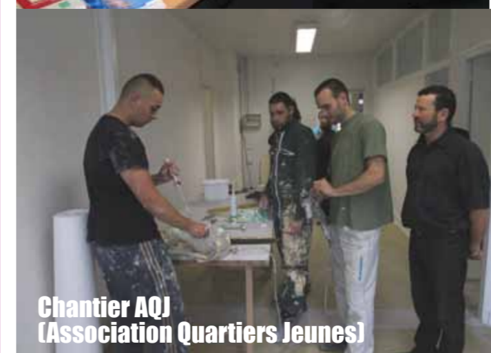
Chantier AQJ (Association Quartiers Jeunes)