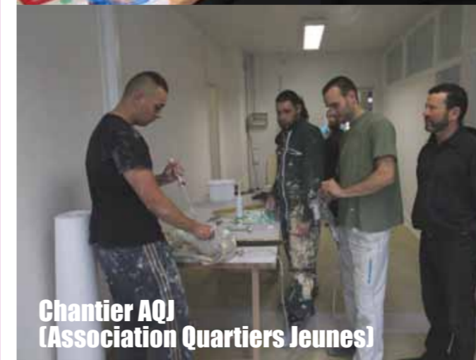
Chantier AQJ (Association Quartiers Jeunes)

« Je suis Président de l'Association Quartiers Jeunes depuis novembre 2008. Sa mission est de repérer les jeunes en difficulté, principalement entre 14 et 20 ans, et de rechercher avec eux des solutions pour contribuer à leur insertion sociale, scolaire et professionnelle. L'équipe éducative est composée de cinq animateurs de prévention et d'un éducateur technique, pour la plupart issus d'Hérouville et ayant une très bonne connaissance des quartiers et des familles. La base de leur activité consiste à être présents sur le terrain. Cela facilite le travail de proximité qui s'appuie aussi sur la libre adhésion des jeunes. Pour que cette mission de prévention soit efficace, il faut que les jeunes soient en confiance avec les animateurs. Ainsi, ce sont des jeunes qui actuellement rénovent les futurs locaux de l'AQJ, au 411 Belles Portes, dans le cadre de chantiers éducatifs mis en place. Nous travaillons en partenariat étroit avec la Mairie, le CCAS et de nombreuses associations hérouvillaises (le Pôle animation et jeunesse, la Réussite éducative, la mission locale...). Ce travail de prévention ne peut être positif que par la participation de divers partenaires. C'est aussi la singularité de l'AQJ, une association unique dans la région quant à son mode de fonctionnement. »