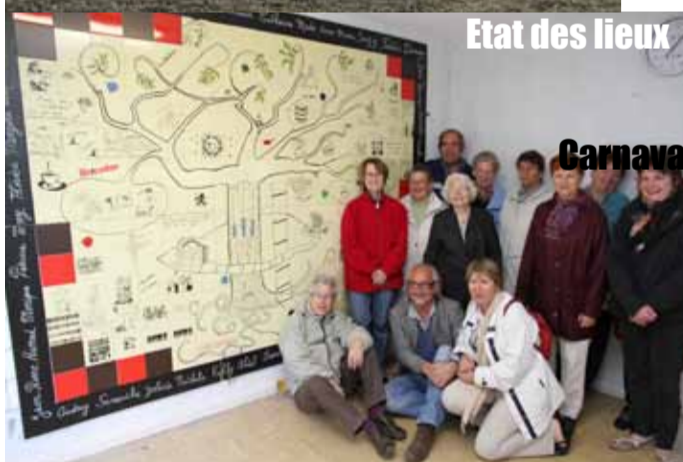
Etat des lieux