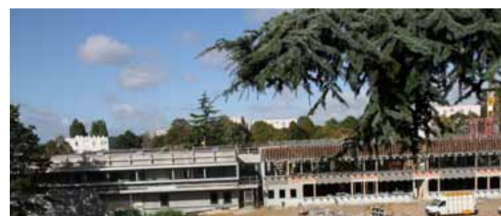
Reconstruction de l'école Malfilâtre

850 c'est le nombre d'enfants qui bénéficient de la gratuité de la restauration scolaire