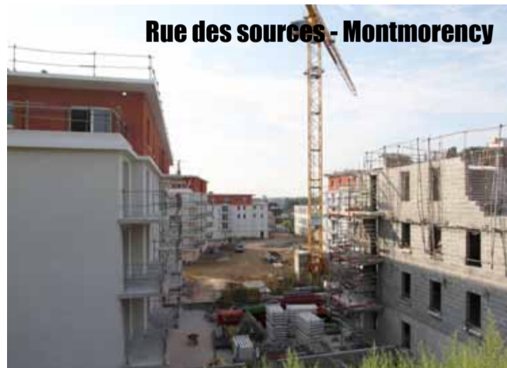
Maisons de ville quartier des Belles Portes