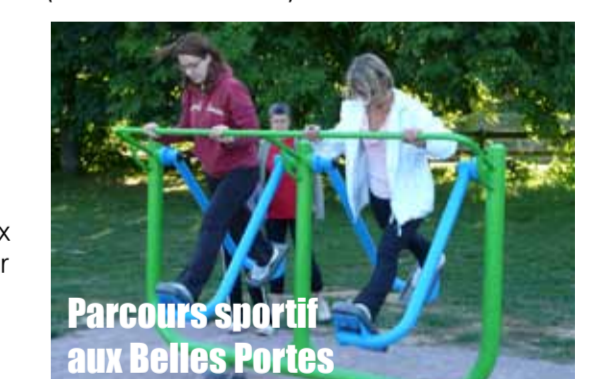
Parcours sportif aux Belles Portes

- travaux d'accessibilité Personnes à Mobilité Réduite, notamment à l'Espace Loisirs Sportifs Hérouville (20 000 € travaux) dans le cadre des 385 000 € de réhabilitation des bâtiments - un parcours de course d'orientation dans le bois de Lébisey et un parcours sportif aux Belles Portes (terrain des cratères)