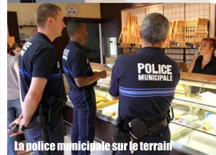
La police municipale sur le terrain