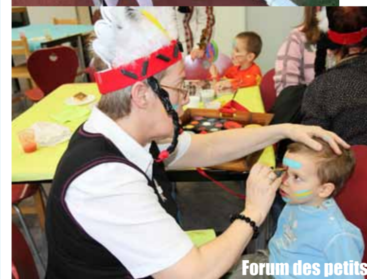
Forum des petits