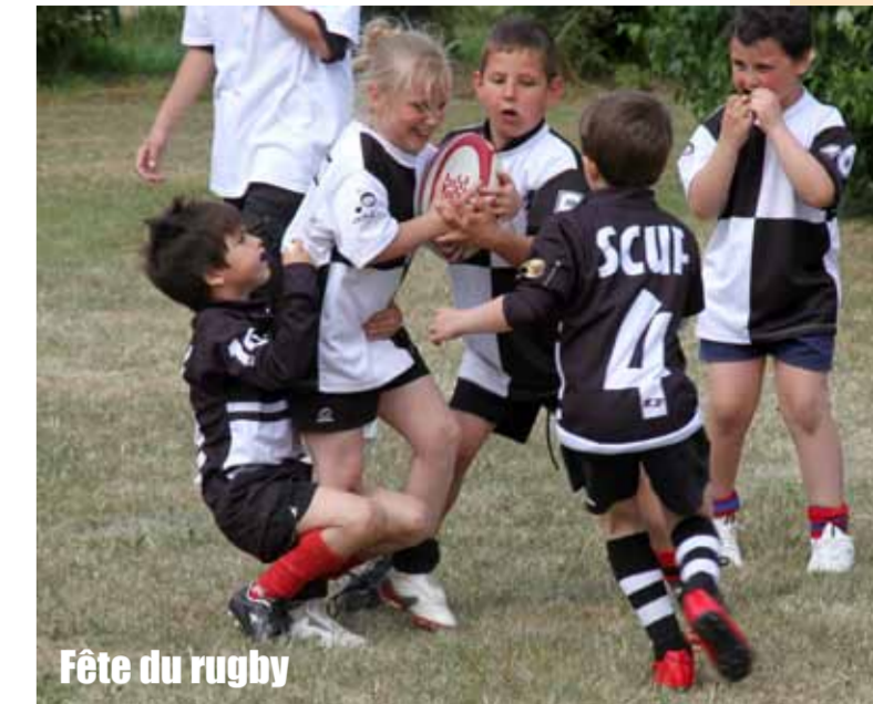
Fête du rugby

Hérouville s'investit en faveur du sport avec une quarantaine d'associations sportives.