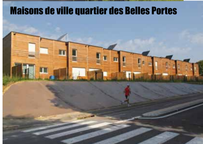
Maisons de ville quartier des Belles Portes