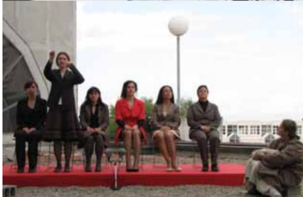
Les archivistes et le Tabularium