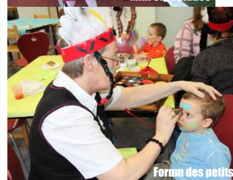
Forum des petits