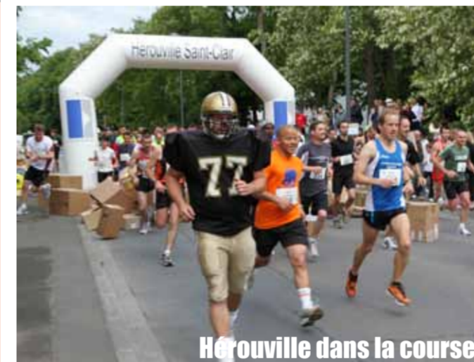
Hérouville dans la course

Des pactes d'amitié ont également été signés avec les villes de Loum au Cameroun (la richesse d'un pays mi-francophone mi-anglophone) et d'Esmé en Turquie (l'ouverture sur la Méditerranée orientale).